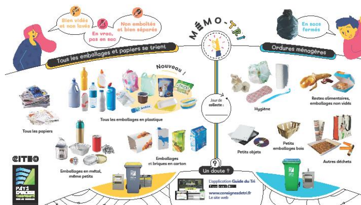
Mémo tri disponible en mairie

Dans le bac jaune, on met les bouteilles en plastique, les emballages en métal, le papier et le carton. Aujourd'hui, grâce à la modernisation du centre de tri, vous pouvez y déposer tous les autres emballages : pots, barquettes, sacs et films plastique. Par exemple : pot de yaourt, tube de dentifrice, barquette de beurre, sachet de chips, couvercles de bocaux... Votre déchet est un emballage (contenant) ? Pas de doute, direction le bac jaune. En vrac et pas dans un sac. Non emboîté, aplati individuellement. Pas besoin de le laver, le vider suffit. Votre déchet est un objet ? Direction le bac bleu (ordures ménagères).