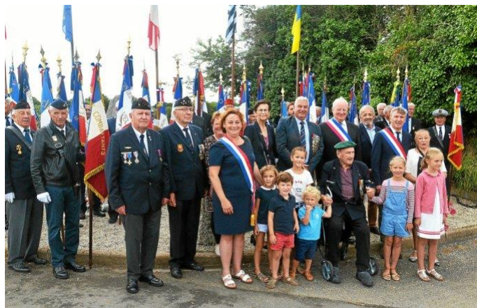
Dimanche 31 juillet : cérémonie en souvenir du maquis de Kergoff