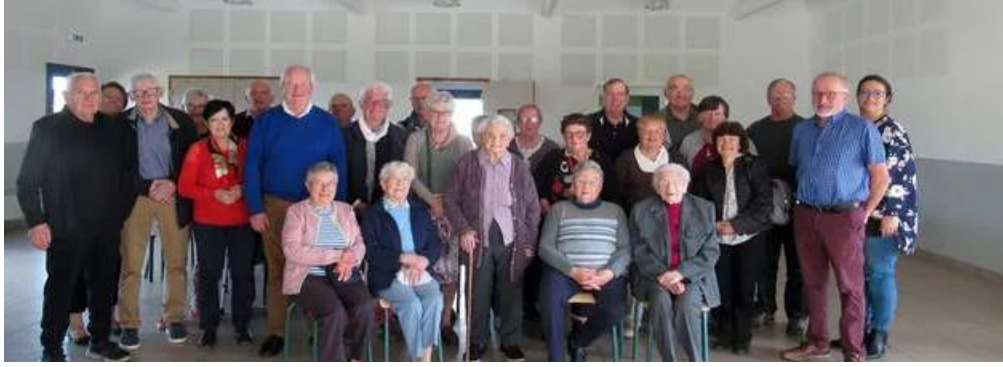
Le groupe des aînés lors du repas annuel du CCAS qui a eu lieu samedi 8 octobre